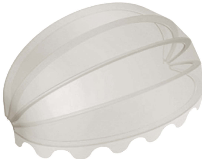
Ovale . Oval

Korbmarkisen mit Seilbedienung, besonders geeignet für Geschäfte und allgemein für Schaufenster und Fenster. Rahmen mit Lackierung mit Polyesterpulver, die in unserem Betrieb nach strengen Qualitätsrichtlinien ausgeführt wird. Konstruktion mit Rahmen aus stranggepresster Legierung und Gelenken aus Thermoplast. Kann sowohl an der Wand, an der Decke als auch zwischen zwei Wänden montiert werden.