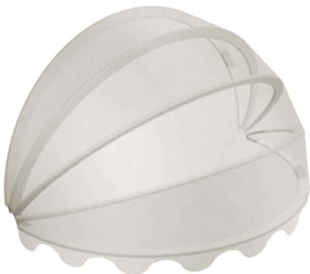
Sphérique . Sphärisch

Store corbeilles avec fonctionnement par concon, particulièrement indiqués pour des activités commerciales et en général vitrines et fenêtres. Structure peinte avec peinture en poudres de polyester, effectuée de notre usine en conformité à des normes de qualité strictes. Structure avec châssis en alliage extrudé et articulations en résine thermoplastique. Applicable au mur, plafond ou sur support.